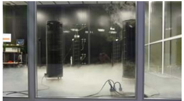
Bild 3: Luftführung im Raum